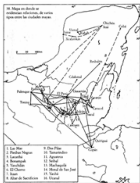
Fig. 2 Mapa de Relaciones Los Mayas del Periodo Clásico, Eduardo Matos Moctezuma

El Usumacinta es el río más caudaloso de México, en el mapa de la zona maya (fig.1) se puede ver la importancia de la